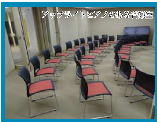
アップライトピアノのある音楽室