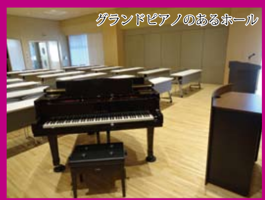
グランドピアノのあるホール