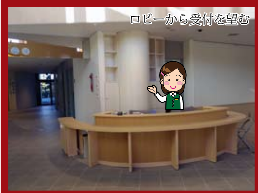
ロビーから受付を望む