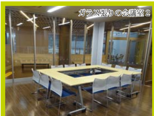
ガラス張りの会議室2