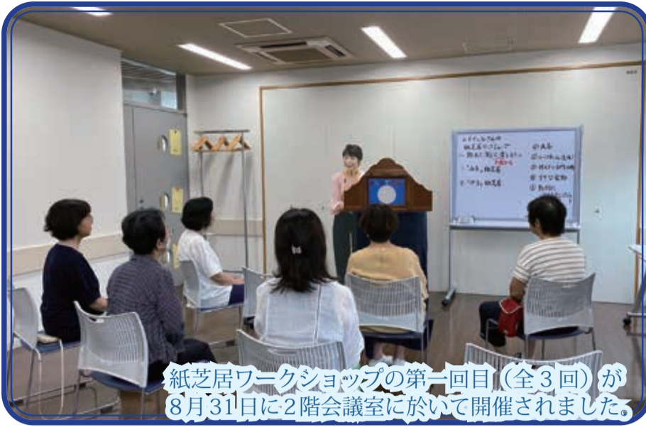
紙芝居ワークショップの第一回目(全3回)が8月31日に2階会議室に於いて開催されました。