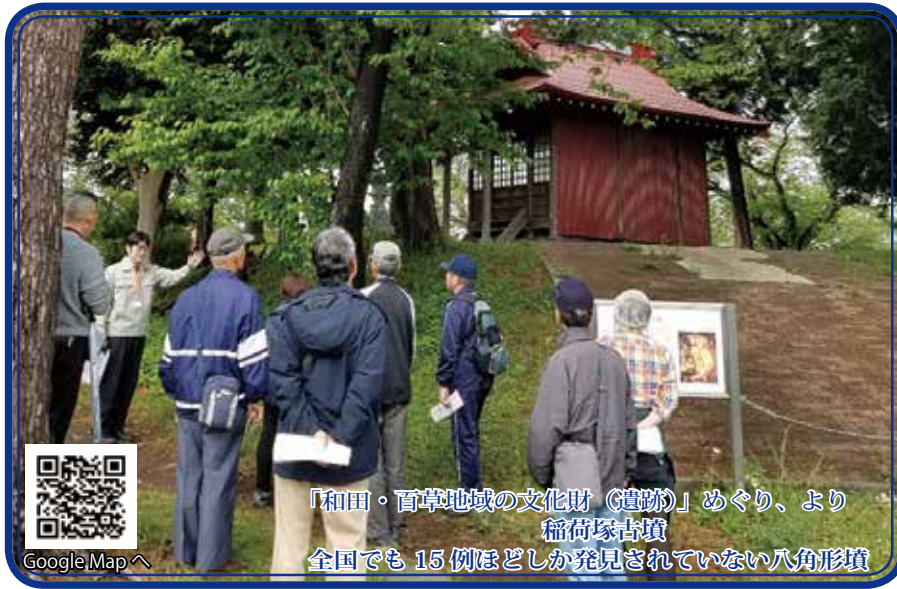
「和田・百草地域の文化財(遺跡)」めぐり、より稲荷塚古墳 全国でも15例ほどしか発見されていない八角形墳